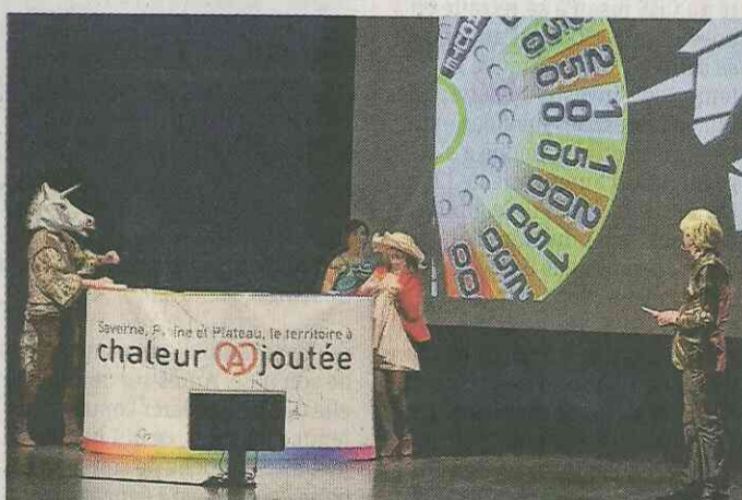
Fausse émission de télé, « la roue de la fortune » avec des vrais comédiens.