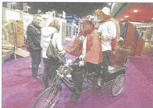
D'avantage d'artistes débambuleront dans les allées pour distraire les enfants, l'espace qui leur était dédié n'ayant pu être aménagé cette année pour cause de travaux dans le hall 5. Pour les seniors, l'entrée sera gratuite lundi.

YALLER ce vendredi 13 mars de 11 h à 20 h, samedi de 10 h à 20 h (gratuit jusqu'à 13 h), dimanche de 10 h à 19 h et lundi de 10 h à 18 h (gratuit pour les plus de 60 ans ou présentation d'une pièce d'identité). Tarif : 5 €, gratuit pour les moins de 13 ans et les étudiants (justificatifs exigés), 4 € en prévente sur www.energiehabitat-colmar.fr Parking gratuit, restauration sur place